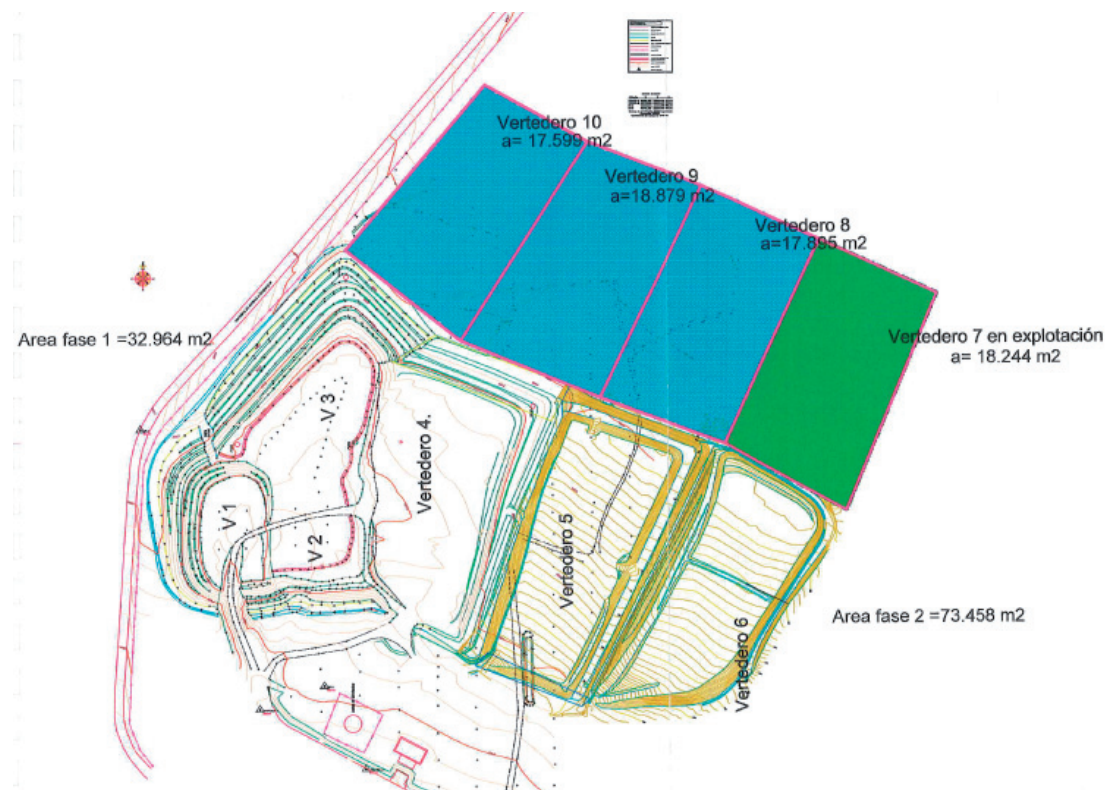
Figura 2. Plano 2 en planta de la instalación. Zona de vasos de vertido.